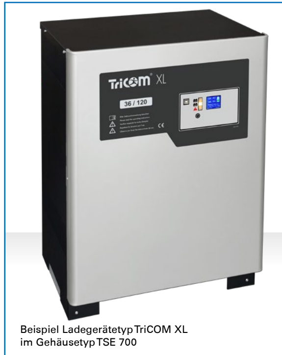
Beispiel Ladegerätetyp Tricom XL im Gehäusetyyp TSE 700