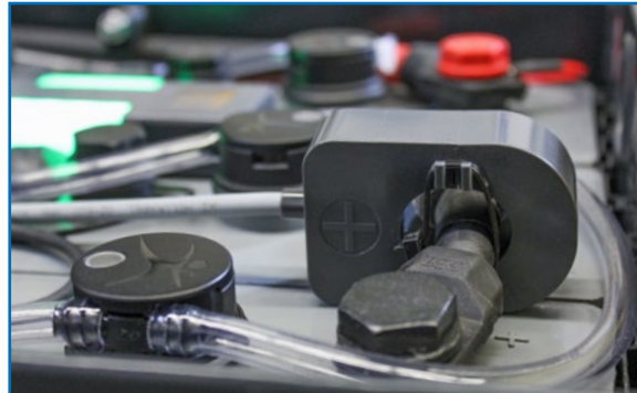
Optional: auch ohne Strommesskopf lieferbar.